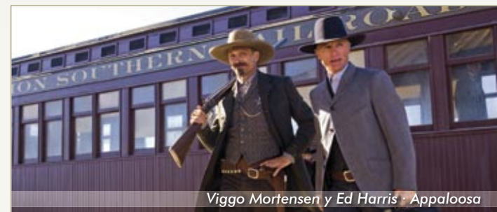
Viggo Mortensen y Ed Harris · Appaloosa

Una ciudad sin ley es casi propiedad de un poderoso ranchero, a finales del siglo XIX. Un sheriff y su socio son reclamados para la protección de los ciudadanos sometidos, pero la aparición de una atractiva viuda pondrá en peligro la buena relación entre los dos y, de paso, el correcto cumplimiento de su misión. Western sobrio y riguroso, donde los diálogos y los trabajos interpretativos destacan por encima del resto de elementos.