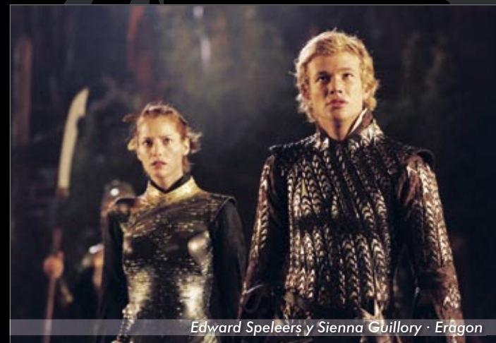
Edward Speleers y Sienna Guillory · Eragon

Intérpretes: Edward Speleers, Jeremy Irons, Sienna Guillory, John Malkovich