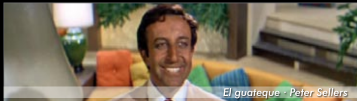
El guateque · Peter Sellers

Un torpe actor de origen hindú es despedido del rodaje por sus continuos errores. A pesar de ello, recibe la invitación del productor para una fiesta que celebra a propósito de su última película. En un evento en el que sólo parece haber gente refinada y elegante, la presencia del actor se convertirá en el desencadenante de toda una serie de dislates y pequeños desastres divertidos.