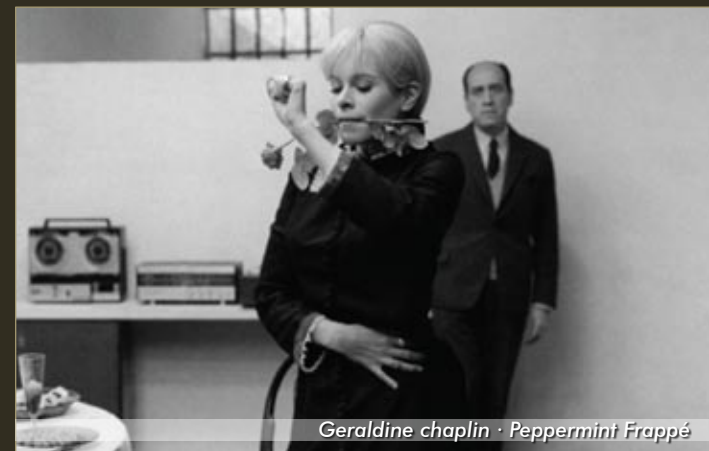
Geraldine chaplin · Peppermint Frappé

Julián, un reprimido médico cuarentón, que vive aislado en Cuenca, intenta transformar a su enfermera Ana, una joven introvertida, en la desinhibida Elena, mujer de su amigo Pablo. Movido por los celos, convierte este atípico triángulo amoroso en una violenta historia.